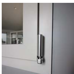
Particolare telaio / anta con vista vetro a filo