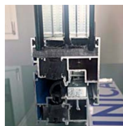
Vista frontale nodo sistema con canalina vetro warm-edge