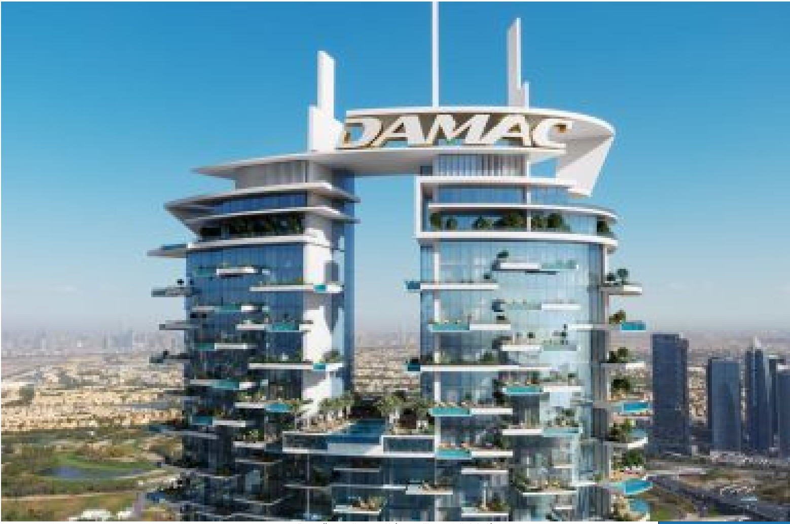
( https://www.niiprogetti.it/la-cavalli-tower-di-dubai/ )