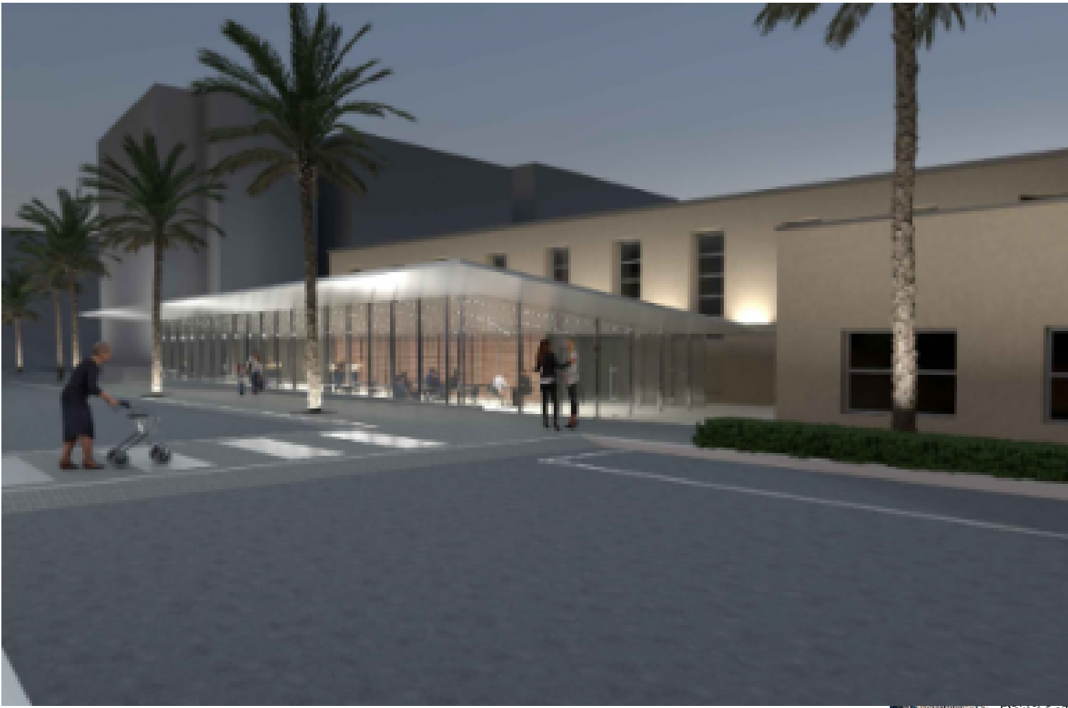
( https://www.niiprogetti.it/nuovo-centro-anziani-a-ventimiglia/ )