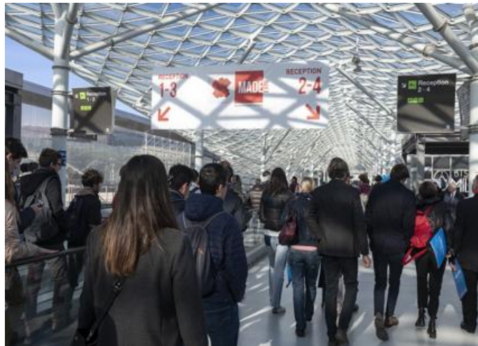
Made Expo a Fiera Milano Rho

Dal 22 al 25 novembre Fiera Milano Rho ospita Made Expo la fiera di riferimento per il settore della progettazione, dell'edilizia e delle costruzioni