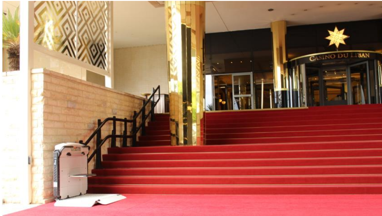
Servoscala a pedana